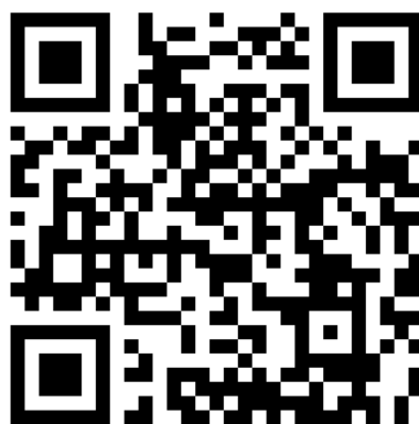
2 QR-код канала Родительской школы